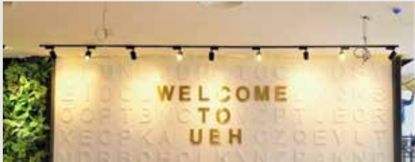
Thư viện Đại học Kinh tế Thành phố Hồ Chí Minh (Cơ sở B)